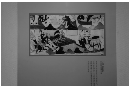
敦煌莫高窟296窟里的《送医图》。