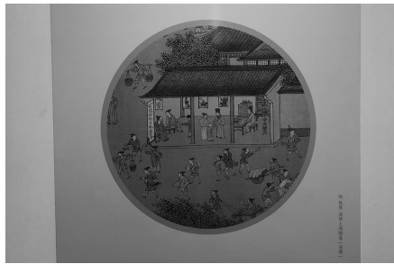
仇英版的《清明上河图》里多处有医药场景出现。