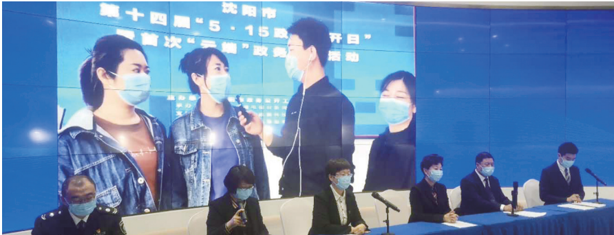
5月15日,沈阳首次举行“云端”政务公开活动。

根据最新变化,现在沈阳市的防疫形势到底如何?采取了哪些重点防疫新举措?现在中学生返校推迟,学生们是否能够完成本学期的教学计划?校外培训机构何时开学?文化娱乐场所复工复产情况如何?在哪些情况下居民需要隔离、需要做核酸检测?搬到“云端”