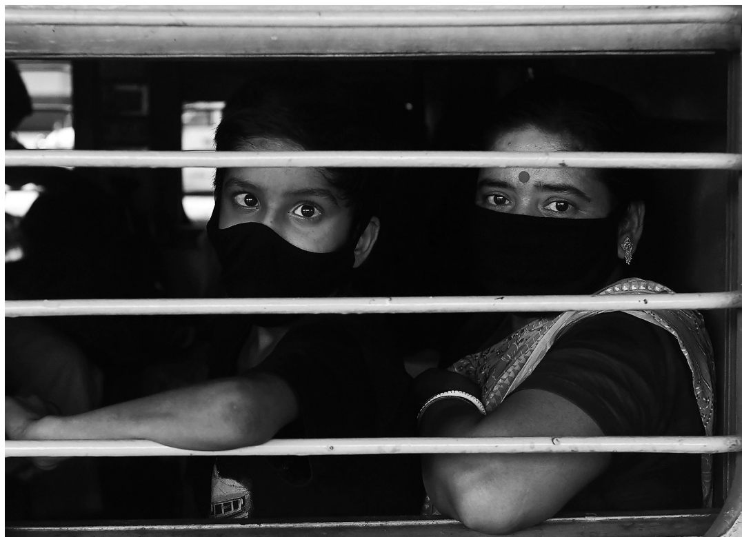
5月12日，在印度加尔各答，人们坐在列车上。据印度铁路部门消息，印度客运列车服务在暂停51天后，于12日部分恢复，先恢复15对、30个车次的运营，主要为首都新德里与孟买、班加罗尔、金奈、加尔各答等各邦首府间客运班次。

封锁措施，并经过两次延长，目前的期限是5月17日。分析人士指出，虽然严格的封锁措施可以有效遏制疫情蔓延，但在贫民窟这种人口密度高的地方落实封锁措施并不容易。