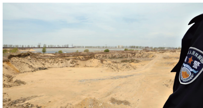
沈阳警方成功打掉一盗采河砂犯罪团伙。