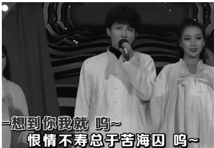
一想到你我就 呜~ 恨情不寿总于苦海囚 呜~

近日,创作出《芒种》《红昭愿》等作品的音乐团队音阙诗听在微博发布维权信息,音阙诗听在微博上表示:我们是《芒种》《红昭愿》原创团队和版权方,当《芒种》《红昭愿》被随意使用、改编、演唱,且没有人与我们沟