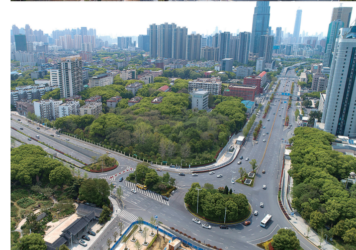
上图为1月26日拍摄的武汉市徐东大街;下图为4月8日拍摄的武汉市徐东大街。