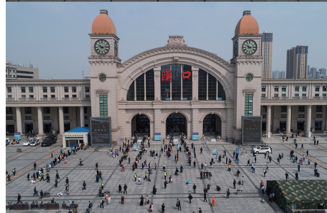
上图为2月10日拍摄的汉口火车站;下图为4月8日拍摄的汉口火车站。