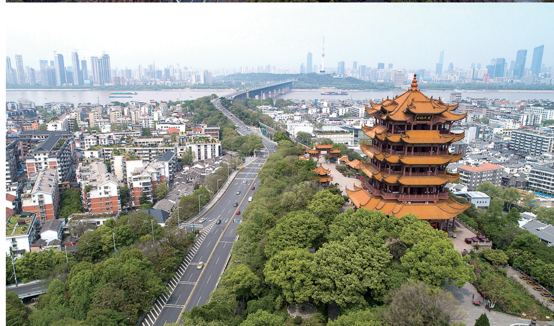
上图为1月26日拍摄的武汉黄鹤楼和长江大桥;下图为4月8日拍摄的武汉黄鹤楼和长江大桥。