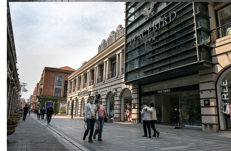
上图为1月26日拍摄的武汉市楚河汉街;下图为4月8日拍摄的武汉市楚河汉街。