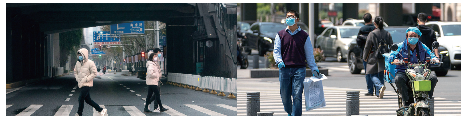
左图为1月26日,行人在汉口的街道上穿过斑马线;右图为4月8日,行人在汉口的街道上穿过斑马线。