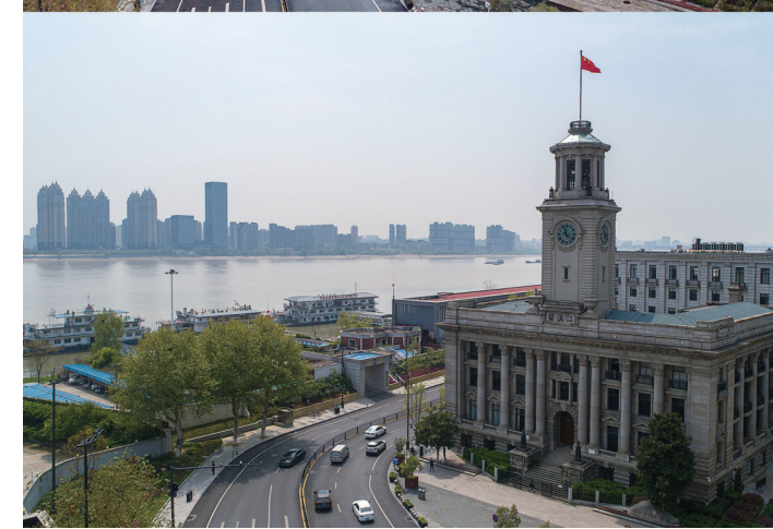
上图为1月26日拍摄的武汉地标江汉关大楼;下图为4月8日拍摄的武汉地标江汉关大楼。