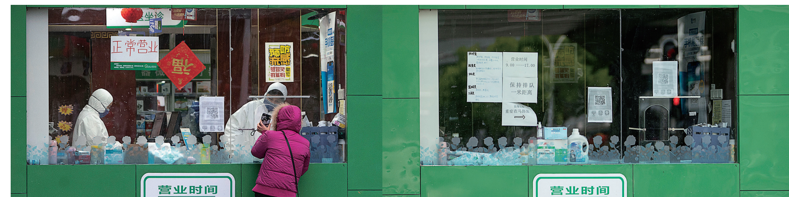
左图为1月26日,武汉市民在药店购买药物,药店工作人员通过窗口与顾客交流;右图为4月8日,由于前来买药的顾客减少,工作人员在中午时分暂时歇业。