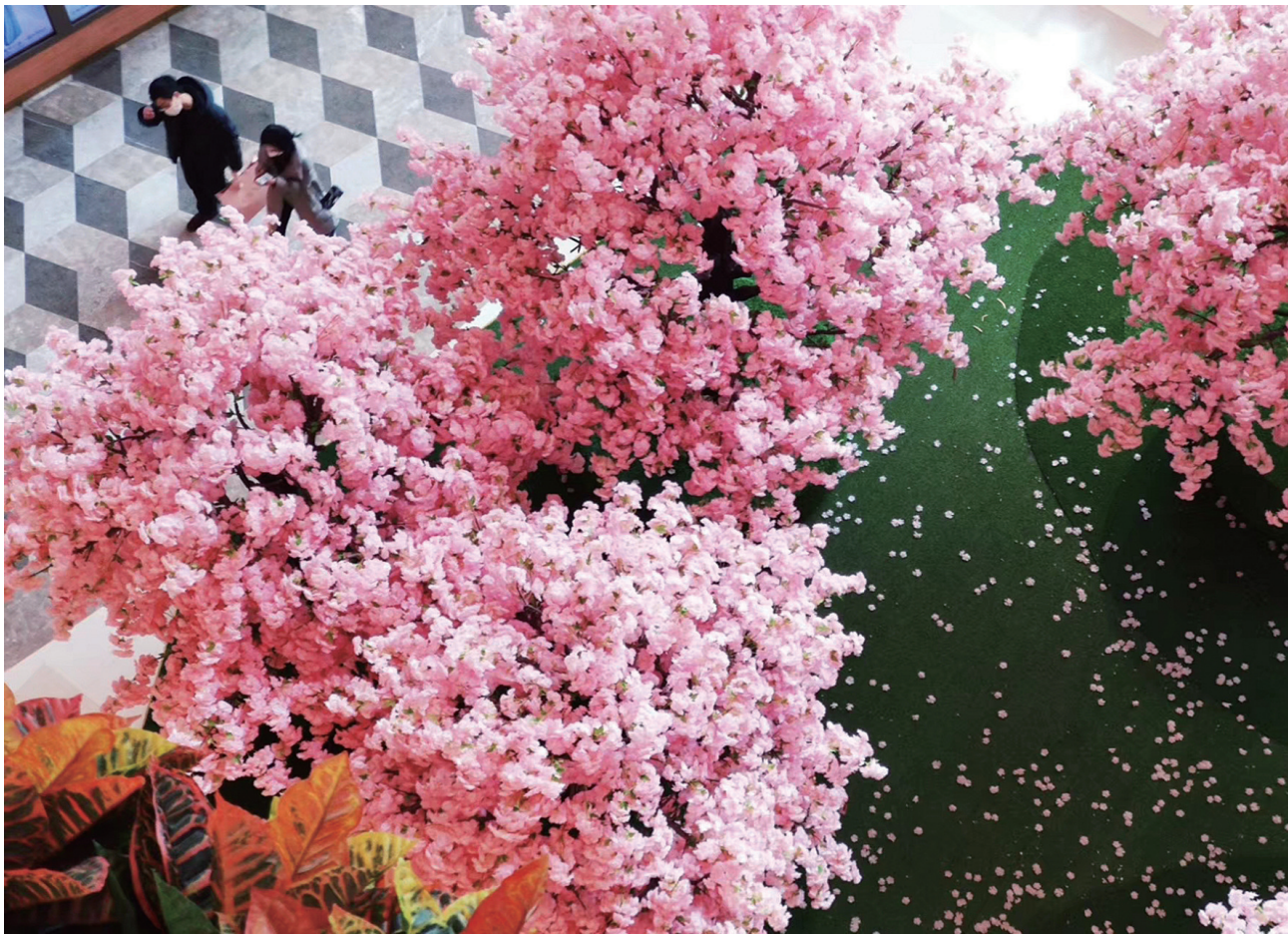
商场里的景致很不错。