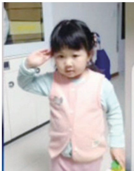
女儿视频中给“英雄爸爸”敬礼。

很感慨。想到十几年的ICU工作经历、十几年不断努力钻研，扎实业务根基，给了足够的信心