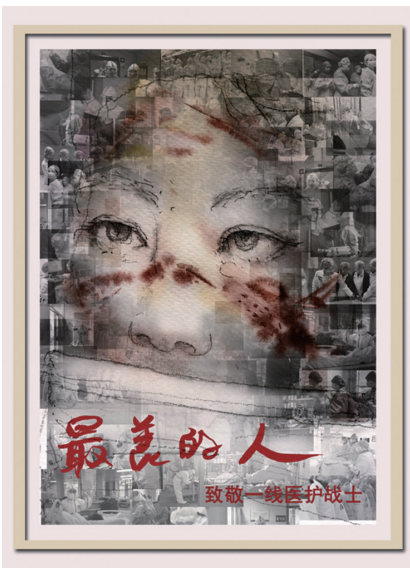
招贴画《最美的人》。作者：李大鹏