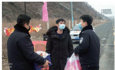
慰问小组给支援湖北医护人员家属送去慰问品。

本报讯 辽沈晚报记者李毅报道 新冠肺炎疫情袭来，抚顺陆续派出三批医疗队共49名医护人员驰援湖北，他们在前线抗击疫情，全力救治患者，是抚顺人民的骄傲。