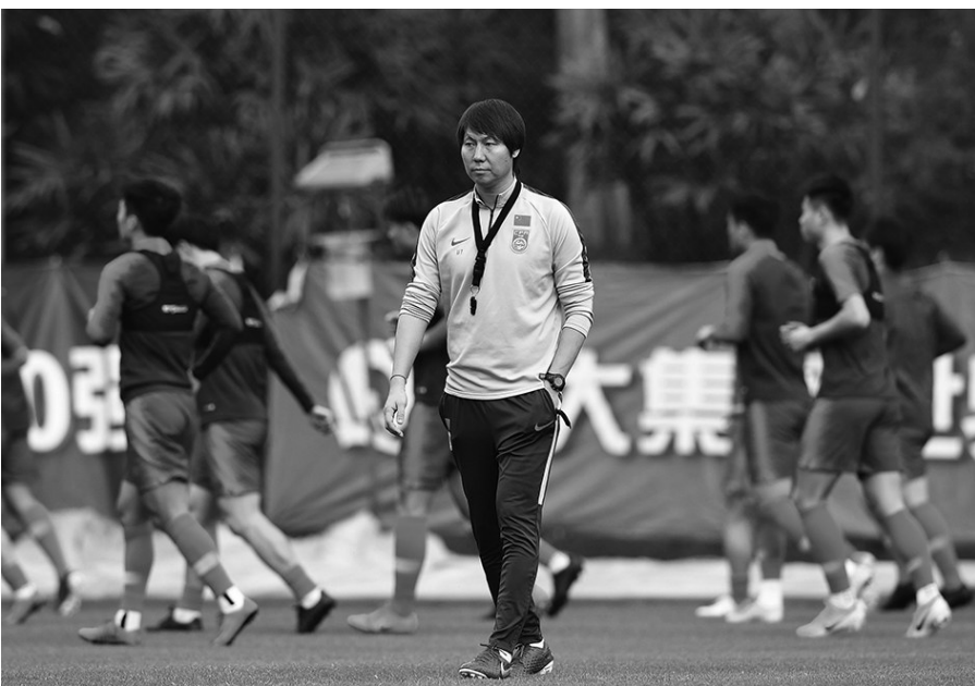
1月6日,国足新帅李铁率领球员进行训练。

要的还是进行体能储备。在佛山集训期间,一天三练很可能成为常态,还将安排两场教学赛。1月23日也就是腊月二十九,全队将进入春节假期。