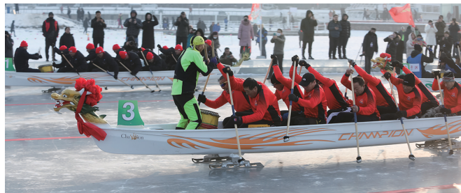
昨日下午,一场激烈的冰上龙舟赛在沈阳浑河冰面上演。

“每天上午10点到12点,下午2点到4点,我们所有的嬉冰嬉雪,包括冰龙舟项目都免费向市民开放。”相关负责人解释。