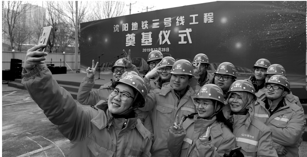
沈阳地铁3号线昨日上午举行奠基仪式,建设者代表合影留念。

30座车站自西向东分别为宝马新工厂、铁西宝马、宝马新城、中德大街、细河悠谷、浑河十五街、工业大学、浑河六街、余良、甘官、千岛湖街、