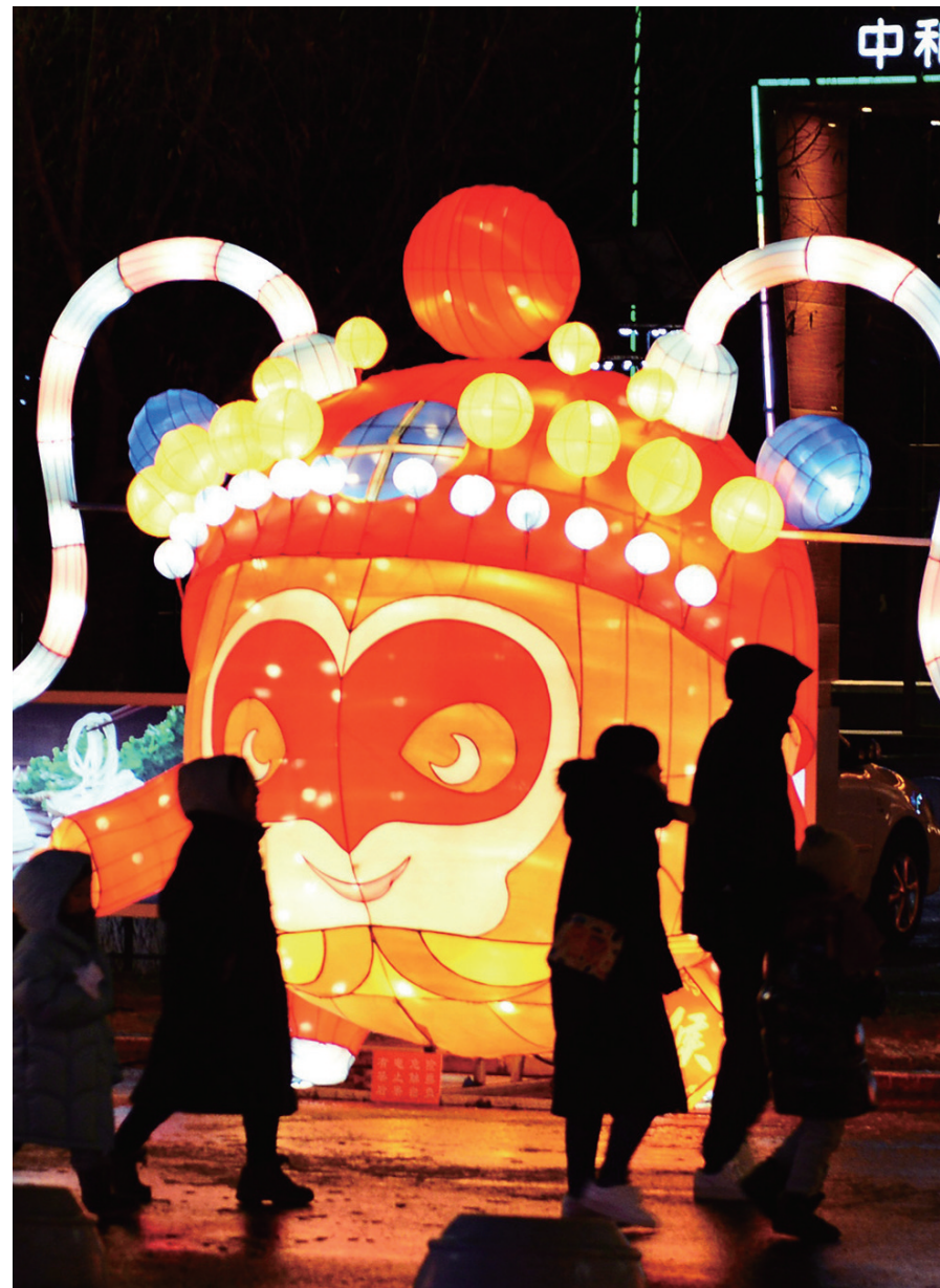
“悟空”灯亮了,萌萌的大头娃娃。