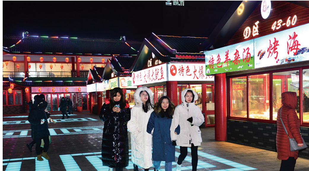
地上的彩灯也亮起来了。