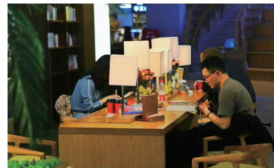
书店给人们提供了舒适的阅读环境。