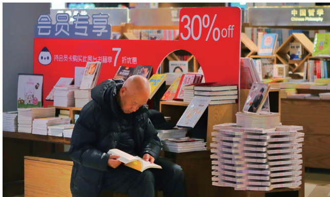
不同年龄的读者在书店中找寻自己中意的领域。