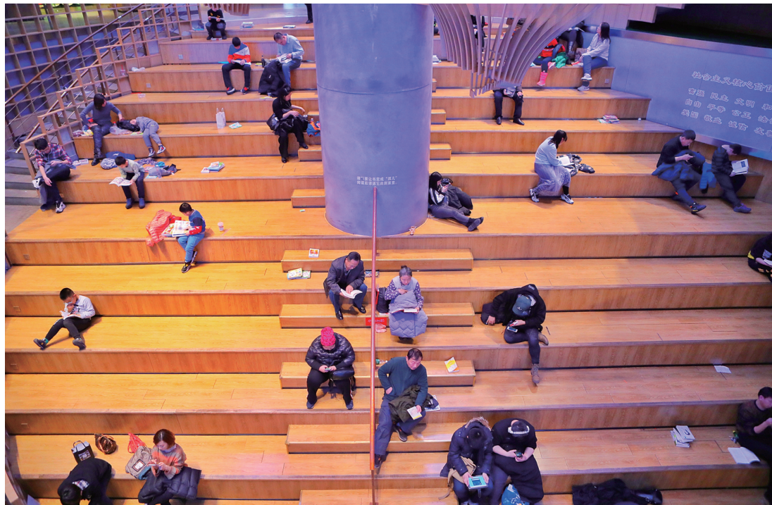
许多家长陪着孩子一起来书店看书。