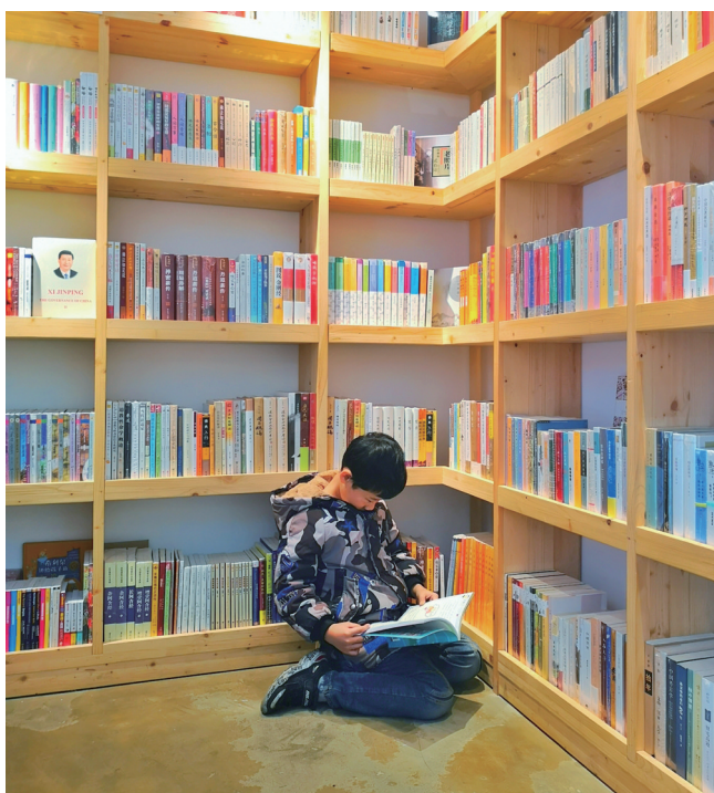
一本书开启一个新的世界。