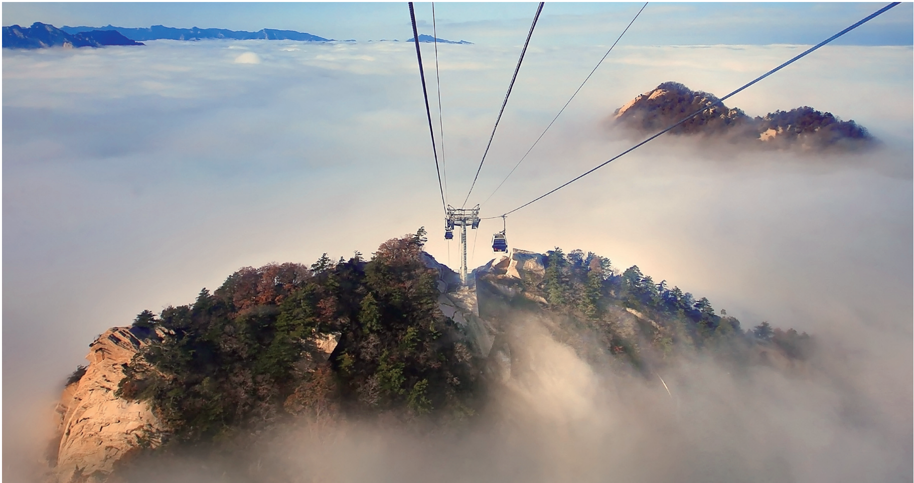
云海中的华山太华索道。