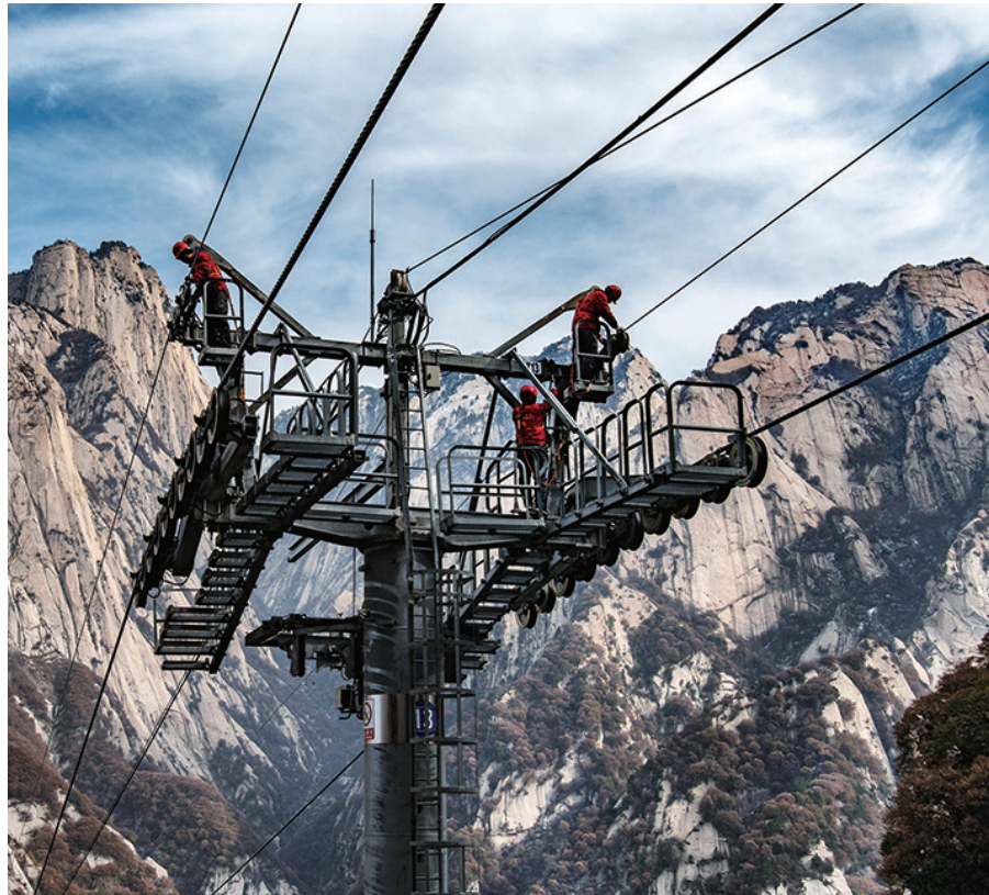
华山太华索道维修人员进行索道支架横担检测。