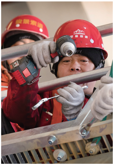
华山太华索道检修人员在进行走台螺栓紧固。