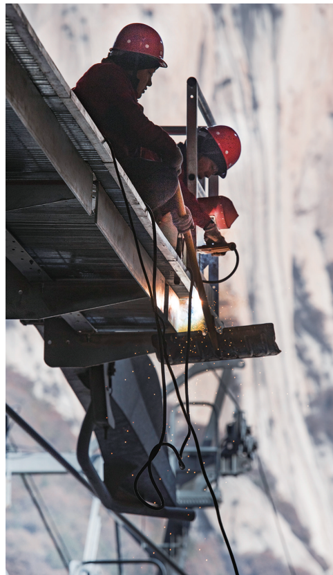
华山太华索道检修人员在进行走台焊接。