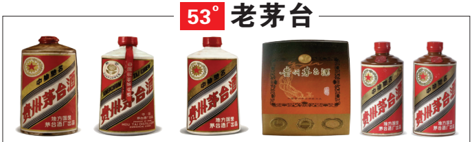
53度陈年老茅台收购价格表69年-50年茅台30万-100万