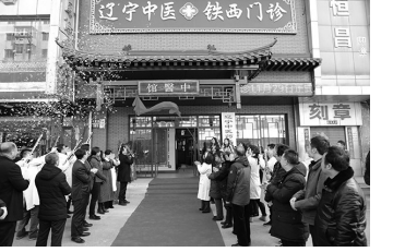
改造,门诊焕然一新,诊室布局更加合理,建成了整洁优雅、古香古色、富有

脑血管、肿瘤、消化系统、呼吸系统及各种眼部疑难杂症等。 为进一步提升患者就医体验,在医院党委的大力支持下,铁西门诊实施了一系列改造工程,增设智能中药房和智能监控、排队叫号系统,派出数十位国家级和省级知名专家出诊,中医治疗室在原有针灸、拔罐、按摩的基础上增加了艾灸、雷火灸、督脉灸、刮痧及中药离子导入、眼针等中医特色疗法。经过历时三个月的全方位装修