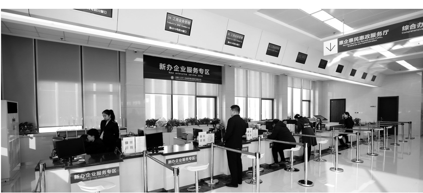
昨日,沈阳市第一家“企业服务中心”——沈阳高新区、自贸区沈阳片区企业服务中心正式启动。

昨日,沈阳市第一家“企业服务中心”——沈阳高新区、自贸区沈阳片区企业服务中心正式启动运行,原浑南区政务服务中心的19个职能部门涉企审批服务窗口,全部搬迁至新建成的沈阳高新区、自贸区沈阳片区企业服务中心。作为首批“体验者”,沈阳某汽车零部件公司前来办理企业法人变更业务的负责人时薇第一个体验到了便利。 中国辽宁自由贸易试验区沈阳片区、沈阳高新技术产业开发区企业服务中心咨询服务处负责人李茶表示,此次搬迁涉企审批服务窗口的职能部门有浑南区市场监督管理局、沈阳市公安局浑南分局、浑南区商务局、浑南区交通运输局等19家单位,将170多项服务事项进行重新融合,实现了“一体化办公”。“这样一来,不仅提高了工作效率,对压缩企业开办时间,减少企业开办成本也具有重要意义。”下一步,该企业服务中心将实施五大创新举措,推动自贸区沈阳片区的政策优势进一步转化落地。 在推进智慧化审批方面,将启动运行全新的一体化在线审批平台,与市一体化在线审批平台实行实时对接,数据同源,一库共享,统一登录端口,实现市、区相关审批职能部门,包括全区各街道、社区的服务终端互联互通,一网通办,高新区、自贸区全部审批事项均在一张