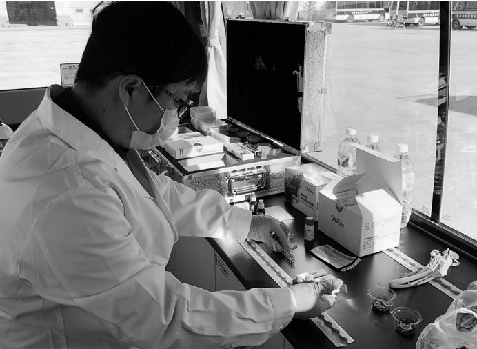
11月25日,工作人员现场展示食品快速检验车如何检测食品。

本报讯 辽沈晚报、聊沈客户端记者朱柏玲报道 在农贸市场是否买到了放心菜,通过快速检验车,在半个小时内就可以找到答案。 昨日,75辆食品快速检验车交付使用,后续还有20辆车配齐完成交付使用,这意味着我省95个县区基本配备了食品检测“移动实验室”,可实现200多项指标的快速检测检验。 11月25日,辽宁省市场监督管理局举行“辽宁省市场监管系统快速检验车交车集中仪式”。 活动现场,记者进入快速检验车,一名工作人员正在对瘦肉精快速检测。快检车的用水、用电、排风等都是按照实验室标准和布局改装的。车内可以外接电源,自身也有蓄电池,快检设备都能正常使用,常见的各种添加剂和重金属、农药、兽药残留都可以像实验室一样进行快检。工作人员介绍说:“快检车不仅可以开到农贸市场、集市进行现场检测,更可以承担一些食品安全应急任务,多数检测项目20分钟以内即可完成,最慢的半小时内完成,像对注水肉的检测五分钟以内就能出结果。”