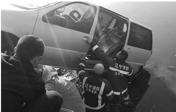
消防员20分钟救出车里被困人员。

8时55分,辽阳市消防救援指挥中心接警后,立即调派辖区弓长岭中队两辆消防车和10名指战员火速赶