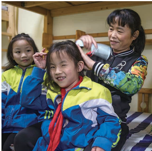
11月11日晚,关爱中心的阿姨在为小朋友睡前梳理头发。