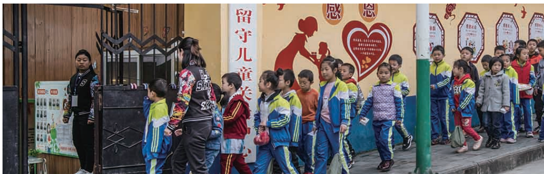
11月11日,关爱中心的老师从附近的小学和幼儿园将孩子们接回“家”。