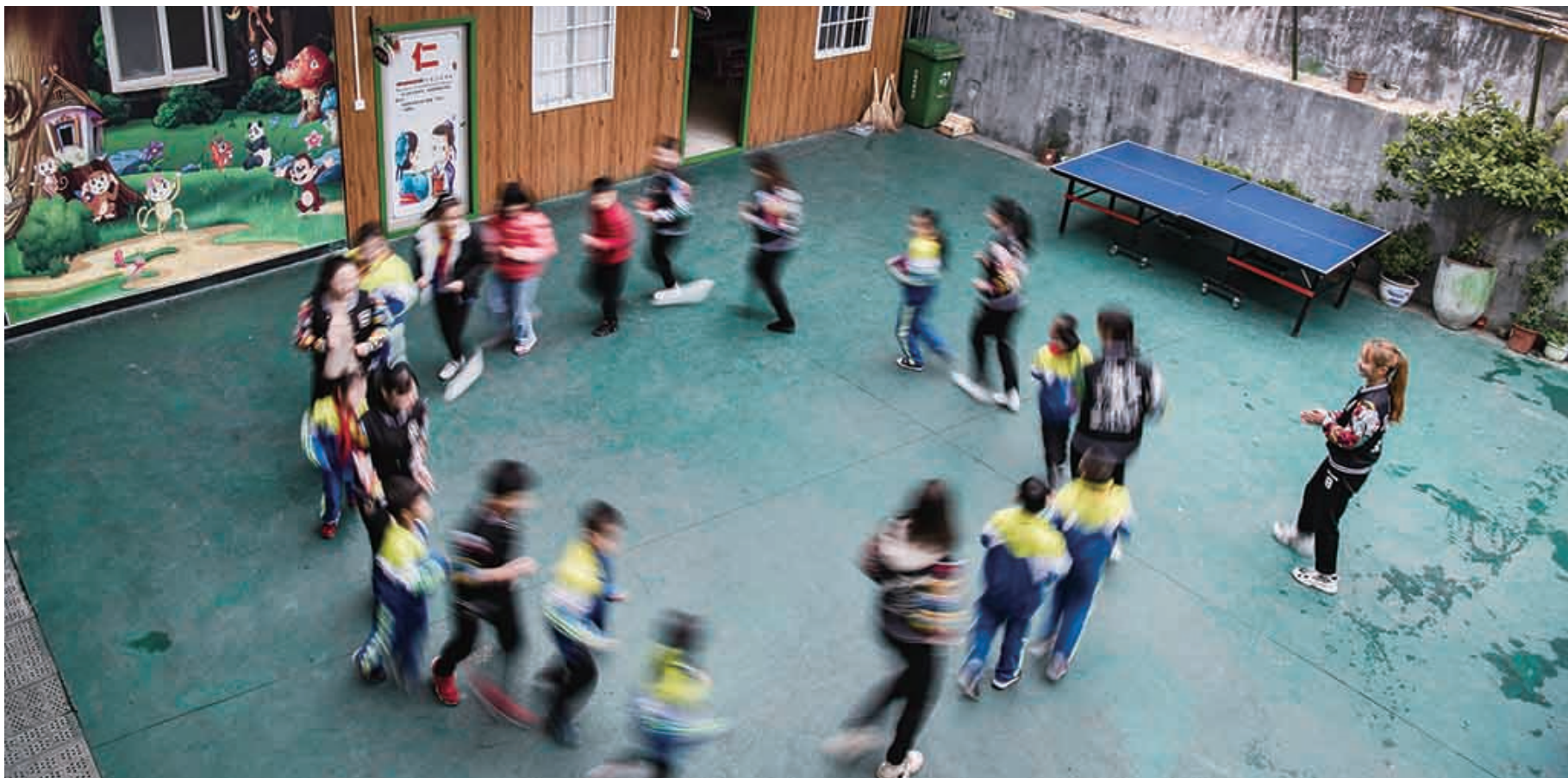
11月11日,关爱中心的师生们在一起做游戏。