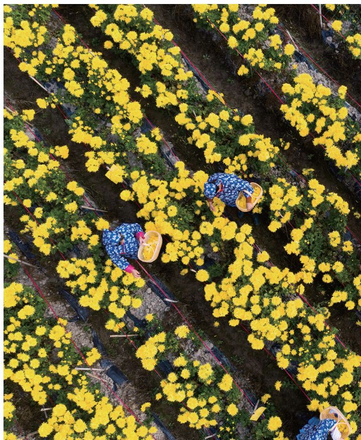
金丝皇菊的产量低,但是它的营养价值高。