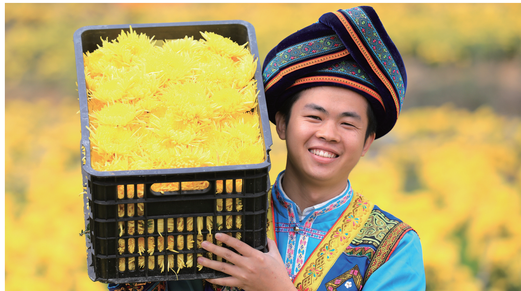
村民在广西融安县泗顶镇振彩村金丝皇菊种植基地展示刚刚采收的金丝皇菊。