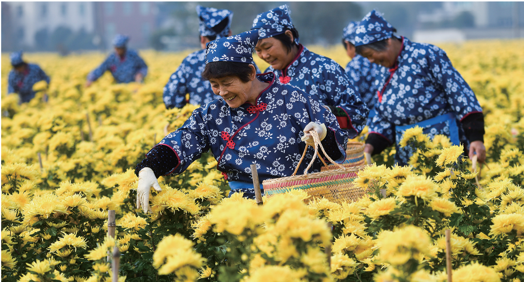
浙江小浦镇中山村的巾帼志愿者在金丝皇菊种植基地帮助低收入农户采摘金丝皇菊。