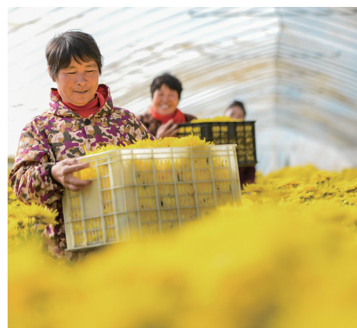
农民在搬运采摘的金丝皇菊。