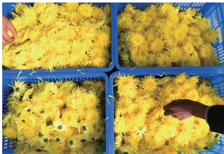
从浙江小浦镇中山村菊花产业帮扶示范基地采摘回来的金丝皇菊。