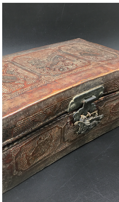
方振生先生与外孙女月亮研讨皮雕箱包的改进方案。 方振生祖母的陪嫁牛皮雕刻首饰盒。05