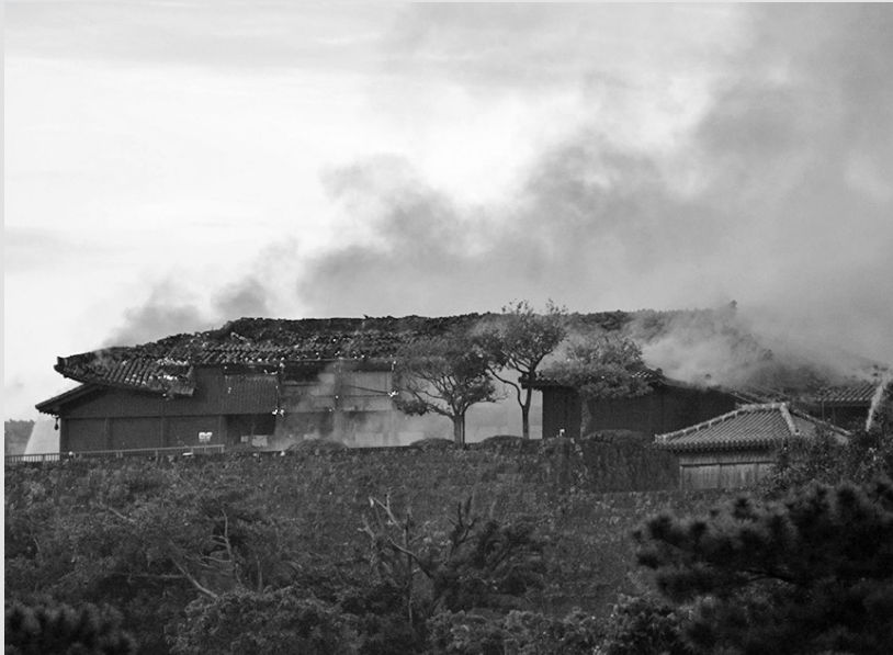
10月31日,在日本冲绳县那霸市,首里城浓烟弥漫。