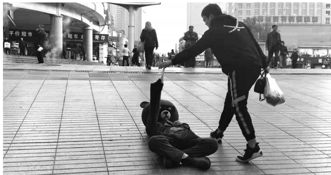
“任性熊”躺着发传单引关注。

“任性熊”凭啥这么火？近日，本报记者来到大连火车站宏孚桥前去揭秘。在人群之中，记者顺利地找到了它。当这只“任性熊”躺下