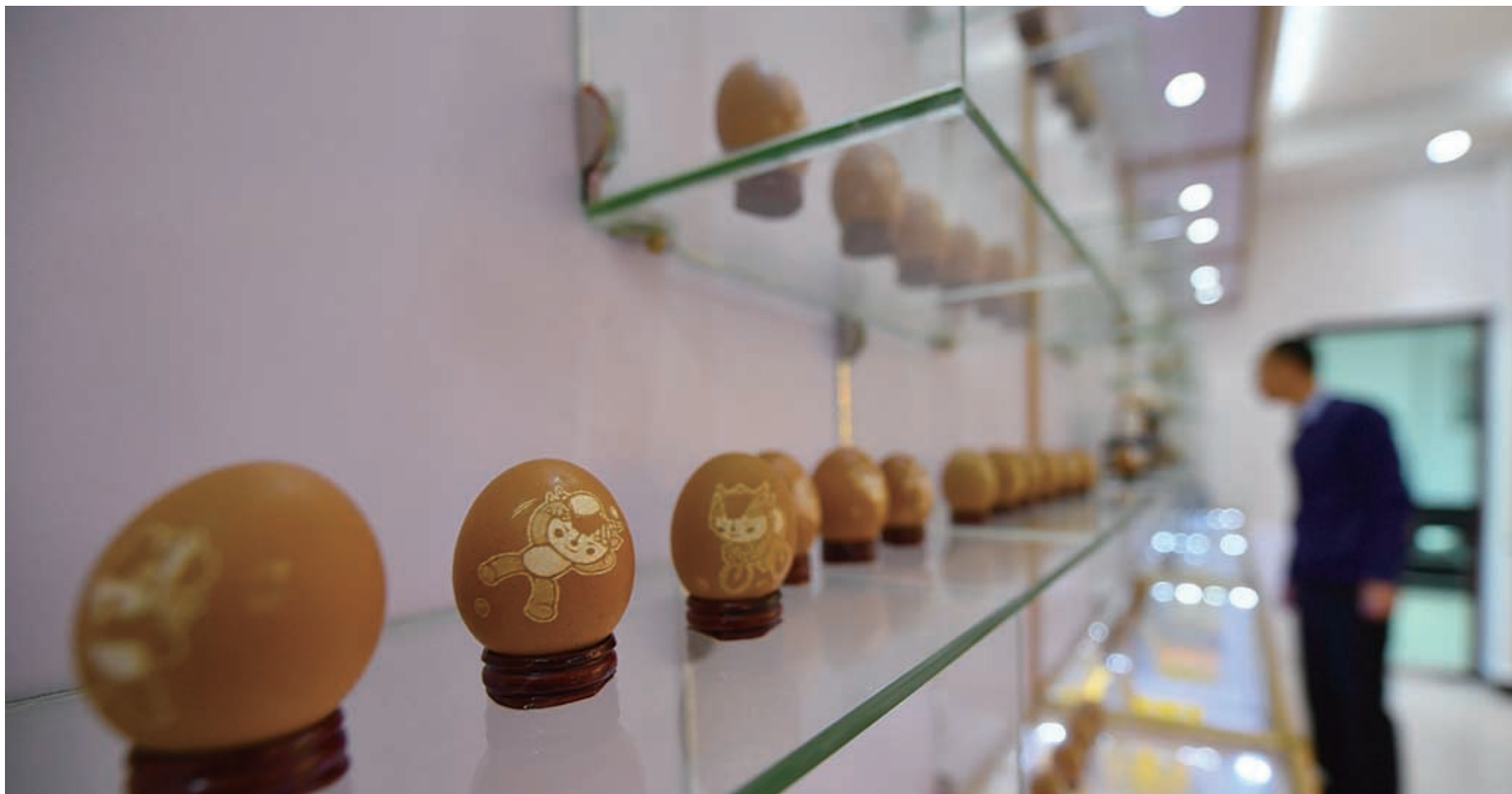
游客在工作室内参观。