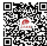
官方微信: 辽沈晚报