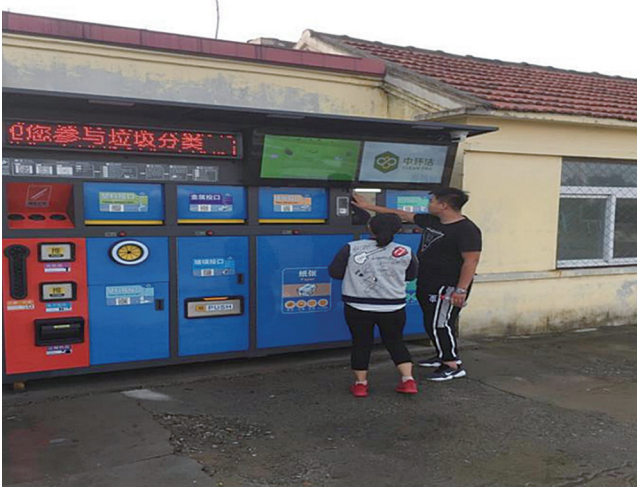
垃圾分类精准,便于使用。