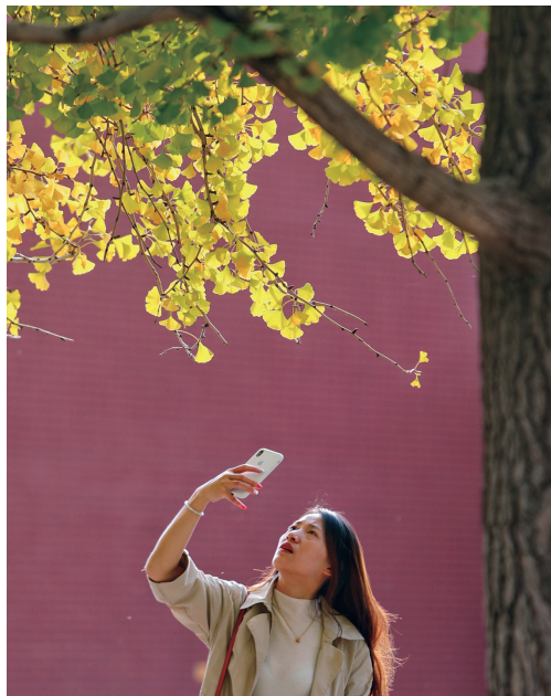
拍下一片叶，收藏美丽秋色。