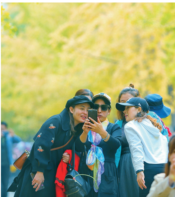
邀三五好友，赴银杏之约。