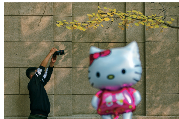
上拍下拍，左拍右拍，摄影爱好者变着花样拍银杏叶。