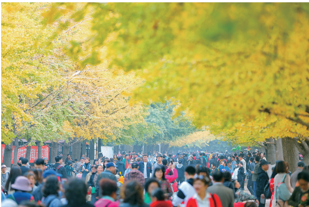
又是一年十月金秋，辽宁大学崇山校区的银杏路迎来八方来客。