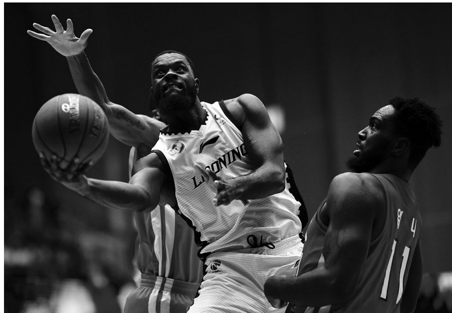
史蒂芬森和巴斯的发挥,直接展现出辽篮新赛季的实力。