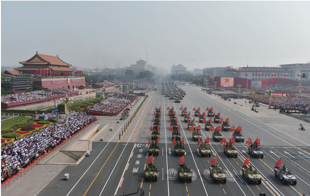
10月1日上午,庆祝中华人民共和国成立70周年大会在北京天安门广场隆重举行。这是战旗方队。