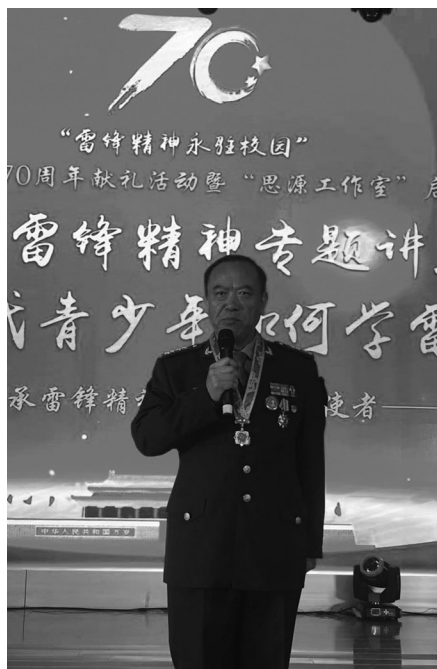
全军学雷锋一级英模张子祥大校在演讲。

此外,雷锋小学还组织部分学生代表与石化大学、雷锋中学共同开展“大手牵小手共同学雷锋”主题活动,选派优秀学生代表在大会中做学雷锋发言。