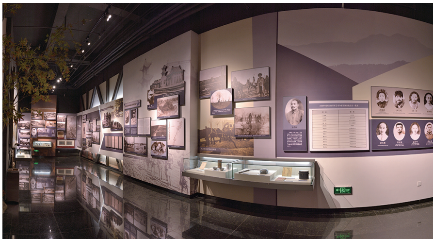
抗日义勇军纪念馆馆内展厅。