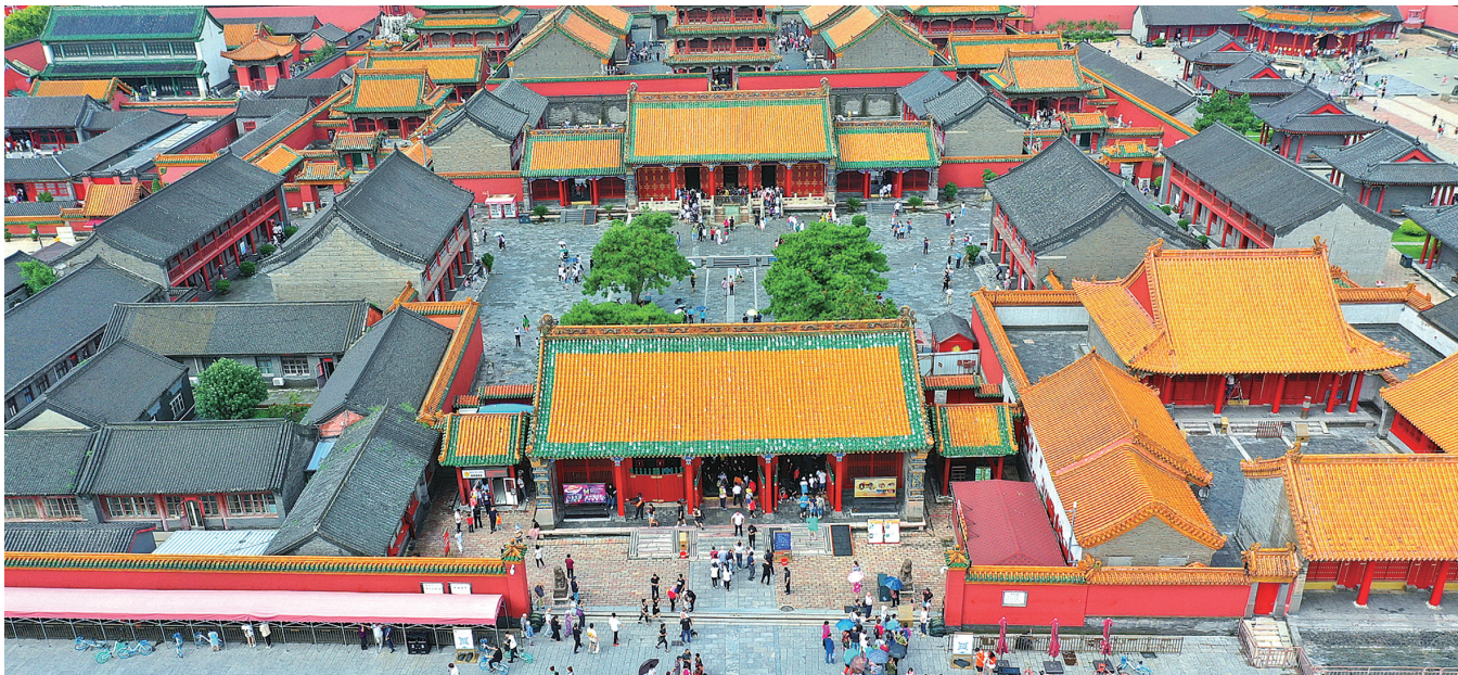
沈阳故宫。

“一宫两陵”更是让沈阳人引以为傲的世界文化遗产，是沈阳的一张世界级的城市名片，它们让更多人知道沈阳，走进沈阳。