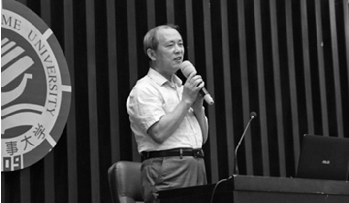
曲建武在大连海事大学为学生们作报告。

但那一刻，他却毅然辞官，要到高校去做一名一线思想理论课教师、一名普普通通的学生辅导员。有人对他说，你这是何必呢？能走到这个级别不容易。