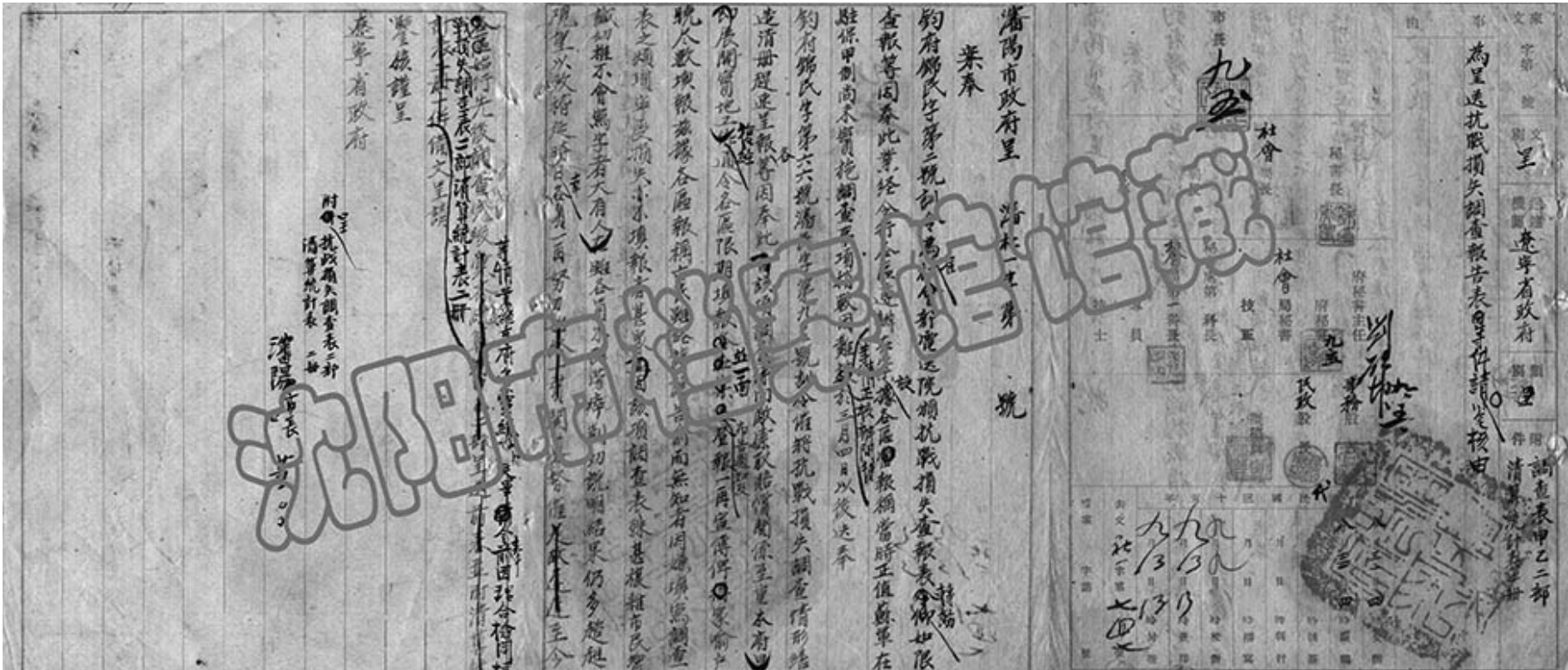
“九一八”事变以来日本帝国主义侵略与殖民统治给沈阳人民造成巨大损失情况统计调查的档案。