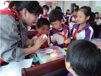
孩子们在老师的指导下开启手工课。

他鼓励留守儿童通过知识改变命运，做一个对社会有用的人。孩子们也被他的激情点燃。在与父母视频环节，叶卓然不断嘱咐妈妈