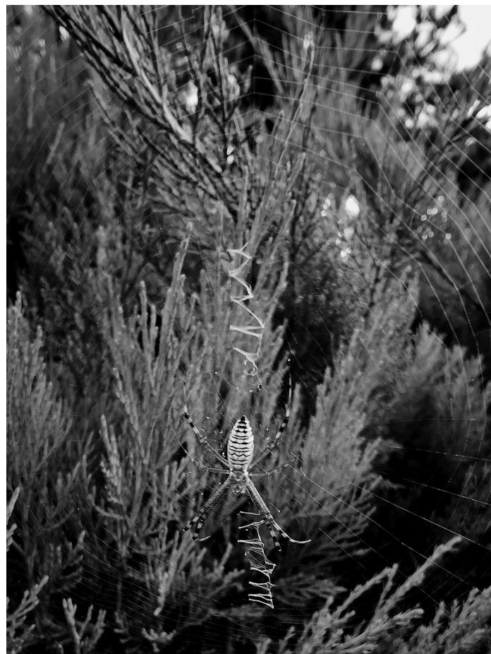
朝阳市民在大凌河岸边拍摄到“会写英文”的蜘蛛。

横纹金蛛一般色彩比较艳丽，这是一种保护色，该蜘蛛体内含有毒液，主要作用是用来麻痹猎物，尽管毒性不是很大，一般情况下也不会主动攻击人类，如果被咬后，会出现疼痛红肿等症状，需要及时用药处理，虽然影响不是很大，但最好还是应该注意防范。