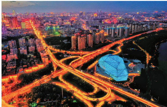
夜色里的浑河岸边,剧院的灯火和璀璨的车灯交相映衬。