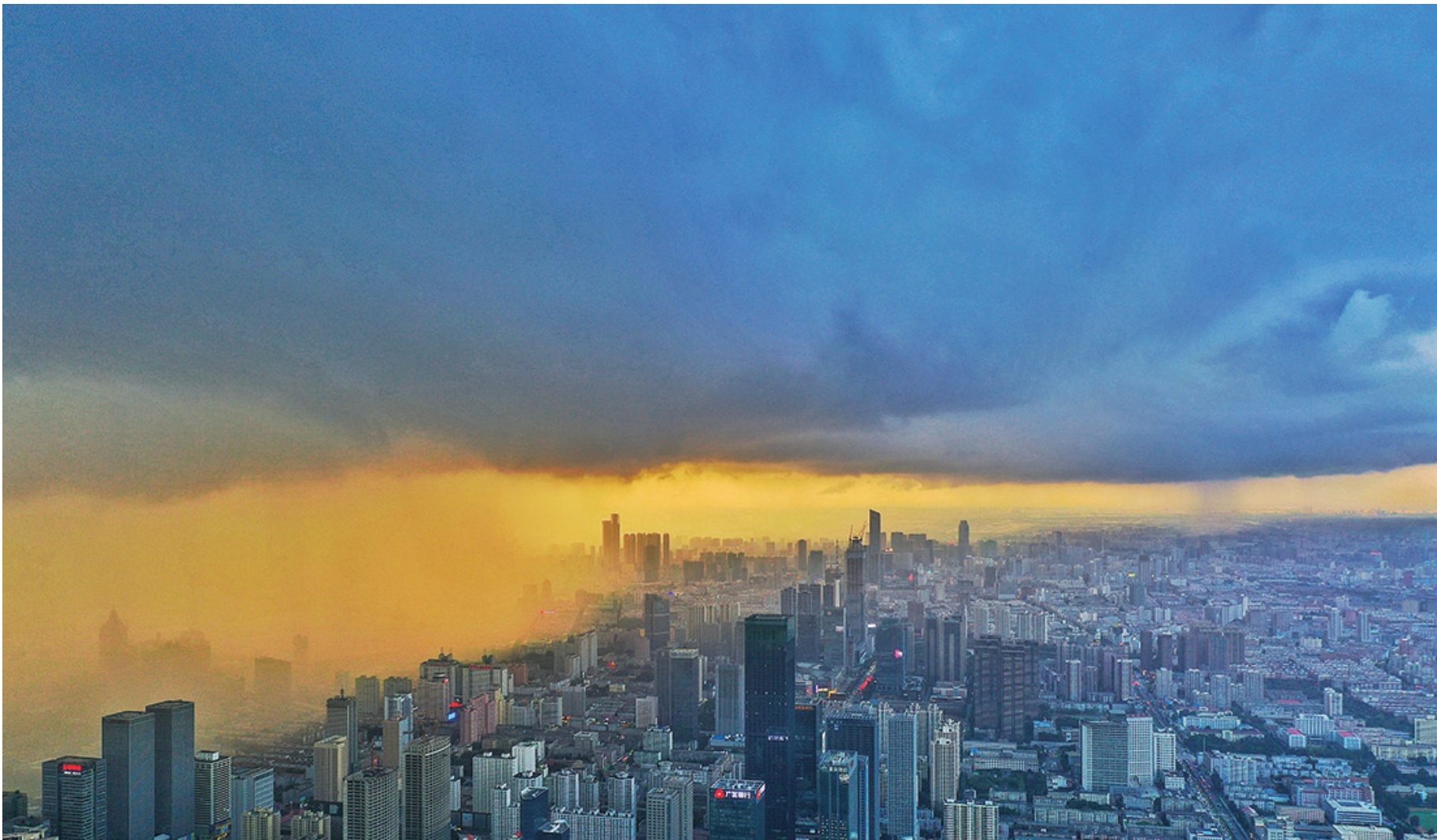
8月29日傍晚,沈阳上空乌云压境,夕阳的余晖透过云隙洒向城市,一场急雨接踵而至。