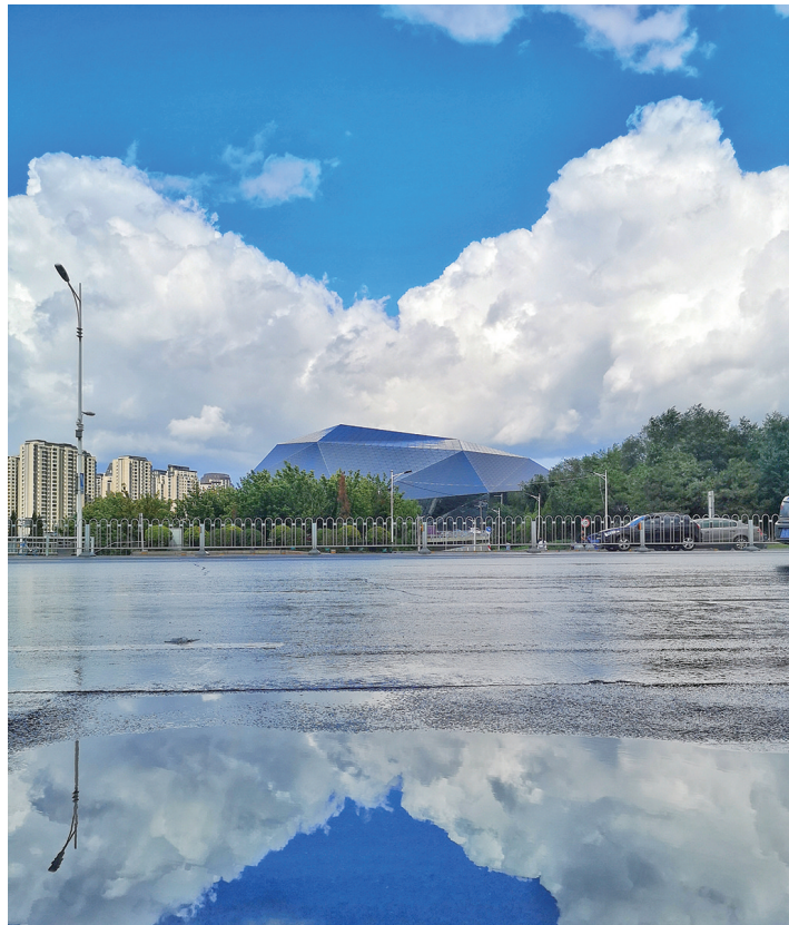
前日午后的沈阳,雨洗蓝天,白云朵朵。