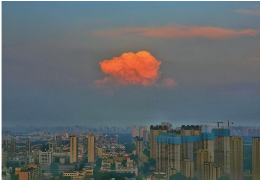
日落西山,天空的一抹孤云被太阳的余光染上了色。