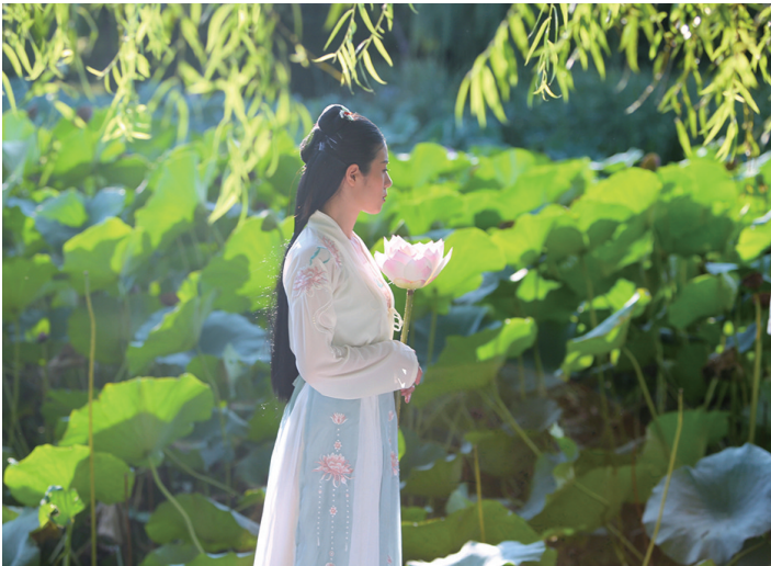
夕阳西下,女孩在荷塘边留影,作别夏天。