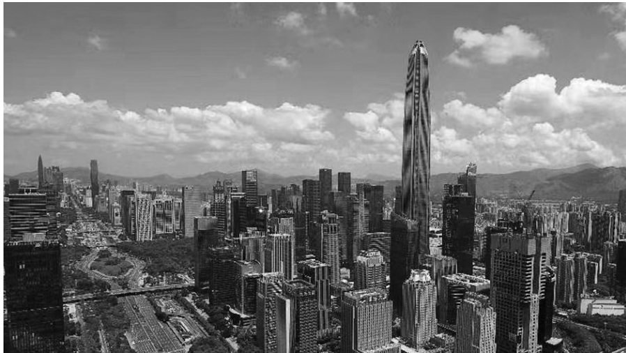
图中最高建筑为平安金融中心。

以陈皮为中心,包含种植业、加工制造业和服务业,从一产辐射延伸到二、三产的区域性新兴产业集群。2018年新会陈皮全产业链产值达66亿元,带动全区农民直接收益12.6亿元。