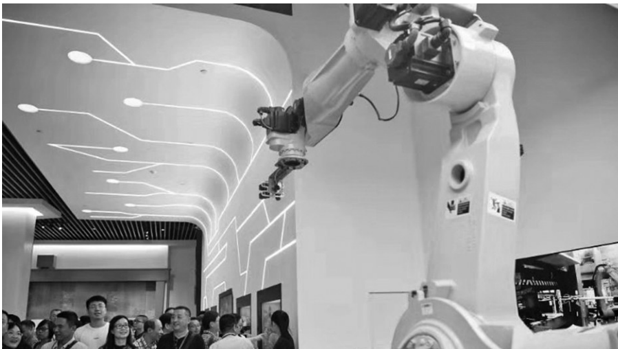
黄埔科学广场综合展示厅。