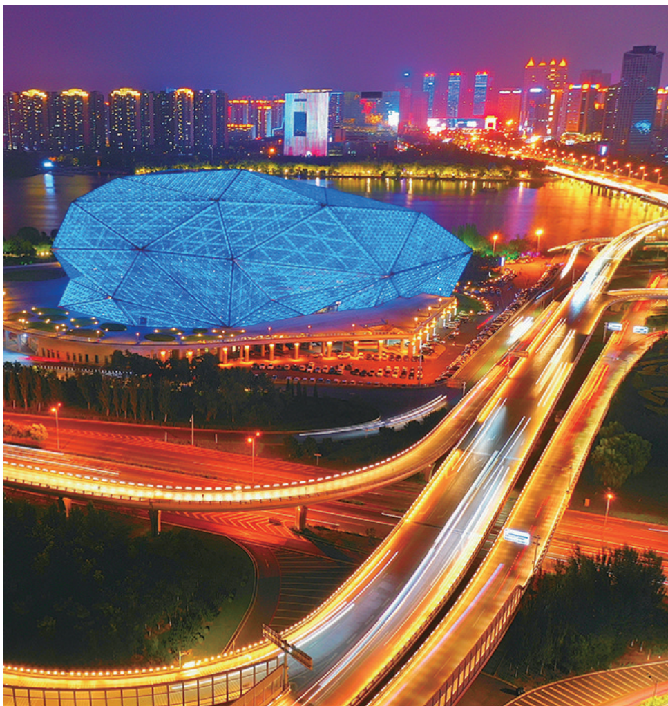
灯光闪耀，车流环绕，浑河北岸的“大钻石”每晚如约点亮。