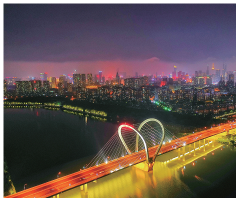
夜色中的三好桥像一颗心，与远处的万家灯火相辉映。