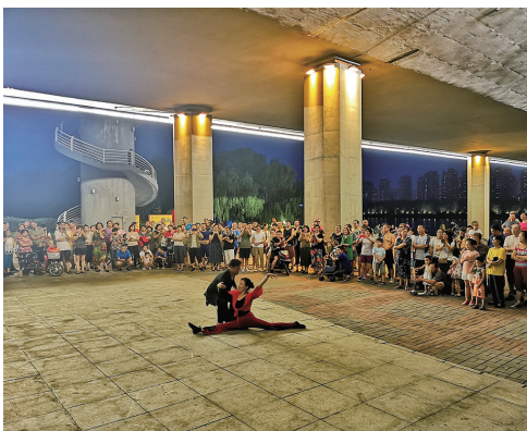
桥下起舞，心有多大，舞台就有多大。