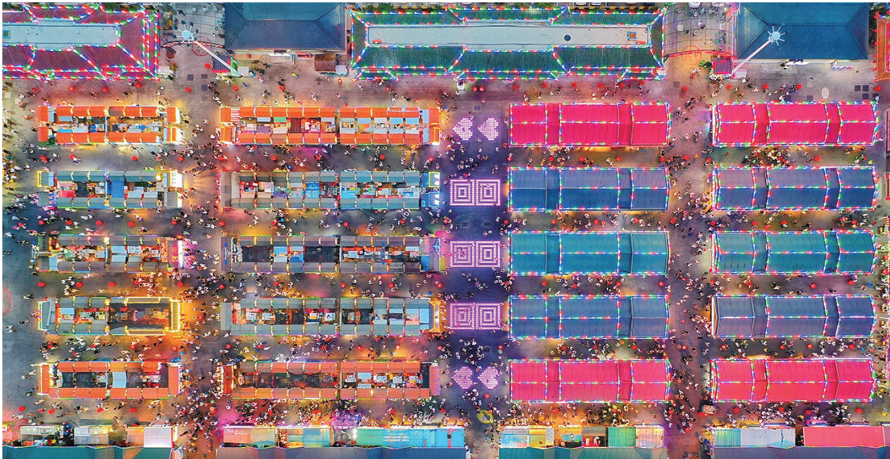
闹市中的烟火人间，舌尖上的乡情乡味，在夜市里都能找寻得到。