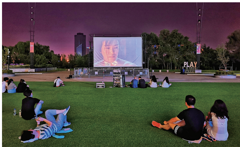
看露天电影，人们三三两两席地坐卧。