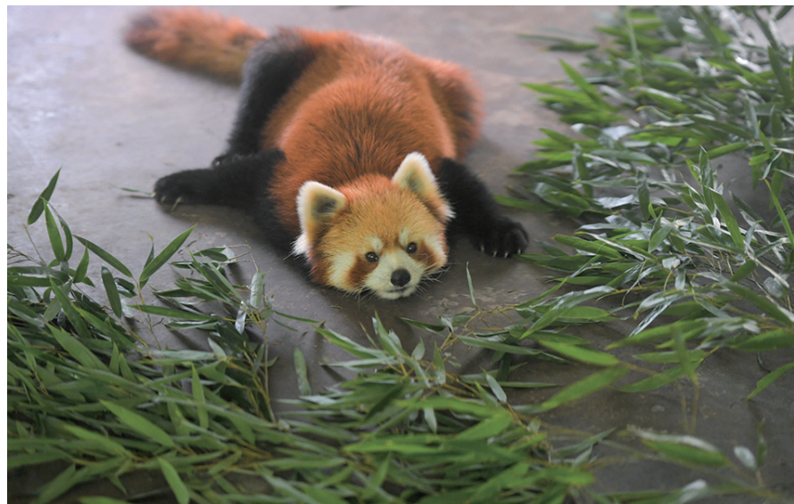
8月2日,长沙生态动物园里的一只小熊猫在空调房里纳凉。