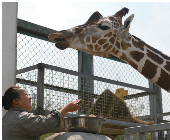
8月1日,合肥野生动物园饲养员在给长颈鹿喂食西瓜。