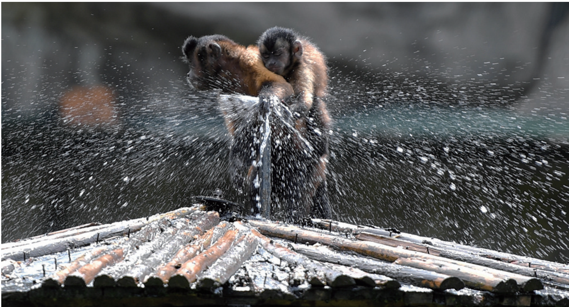
8月2日,长沙生态动物园里的猴子在享受喷淋降温。