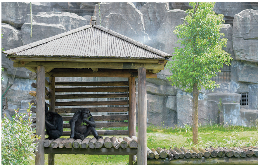
8月2日,长沙生态动物园里的黑猩猩在遮阳棚下纳凉。