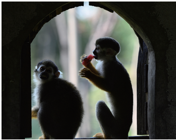
8月1日,松鼠猴在合肥野生动物园内吃瓜果。