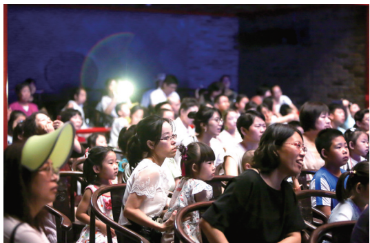
小朋友看得新奇,家长也被剧情带回到童年。