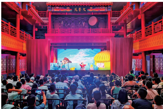
100多位观众做客文馨苑欣赏木偶戏《渔夫与金鱼》。