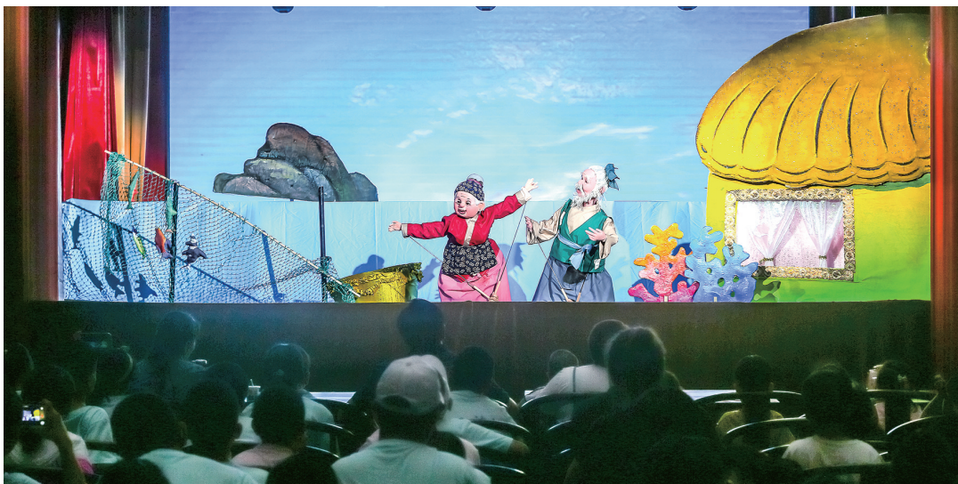
从陆地到海洋,层层布景勾勒出一个童话世界。