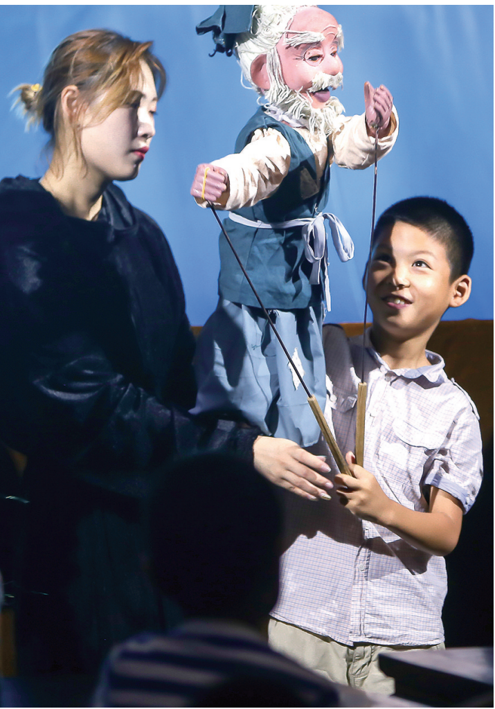
演出结束后的互动环节,小朋友亲手体验了一番木偶表演。