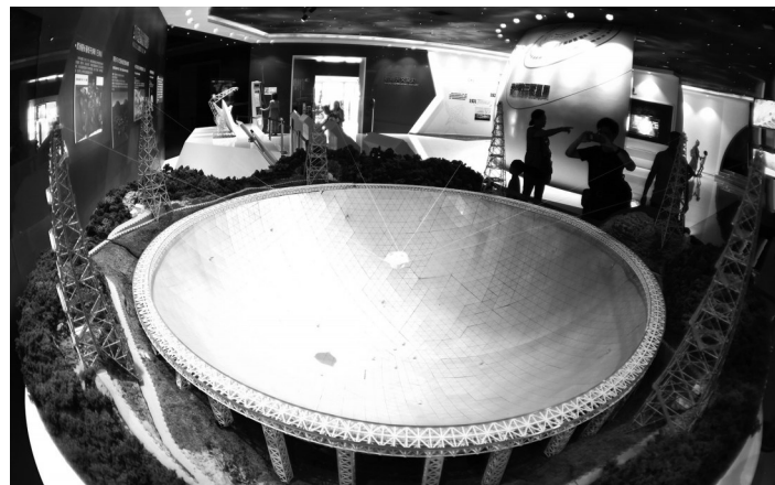
7月24日,游客带着孩子在天文体验馆参观FAST模型。