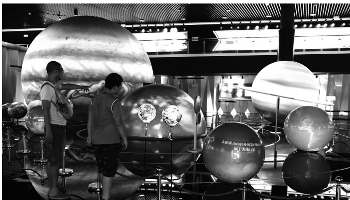
孩子们学习天文知识。