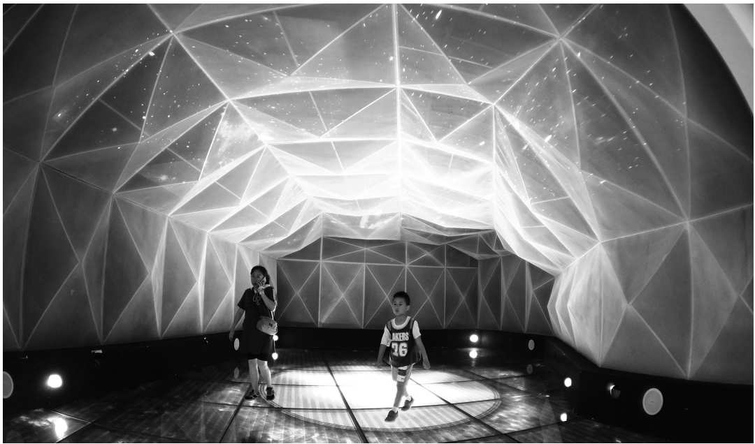
游客带着孩子在国际天文体验馆参观。