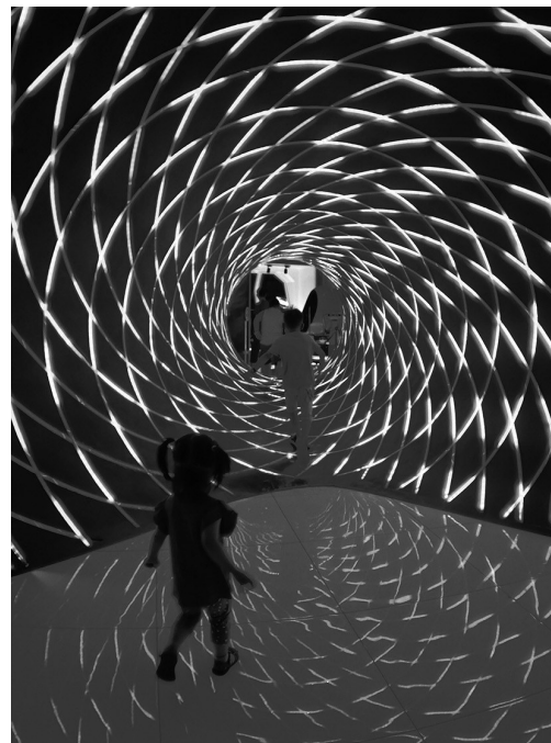
孩子们体验“穿越黑洞”。