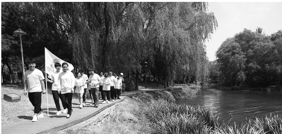
本报志愿者河长开启首次巡河行动。