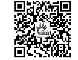
关注·健康 关注·辽沈晚报V健康

健康指导家长帮助孩子养成独睡的好习惯。 健康信息一手掌握,辽沈晚报V健康为全家健康把好关!