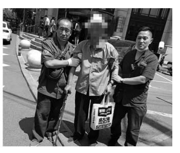
急救人员第一时间帮忙联系老人儿女,并在电话中征求家属意见,将老人送至指定医院...