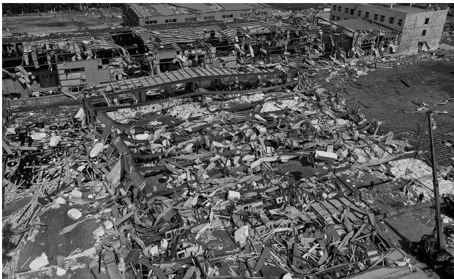
昨日,在开原市金泰粮机公司院内,灾后清理工作已经展开。

美国仲的鼻梁位置受伤,腹部、指尖和手臂也被狂风裹挟的杂物砸破,“口子不深,没去医