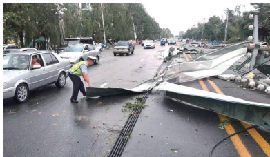
铁岭交警组织280人投入抢险救灾。