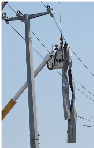
开原市尚品铭城小区门口,施工部门正在进行电力抢修。