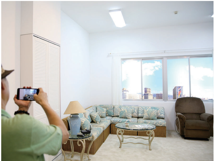
张学良晚年在夏威夷老年公寓的客厅、餐厅被“搬进”大帅府,真实勾勒出了他们在夏威夷生活的原貌。