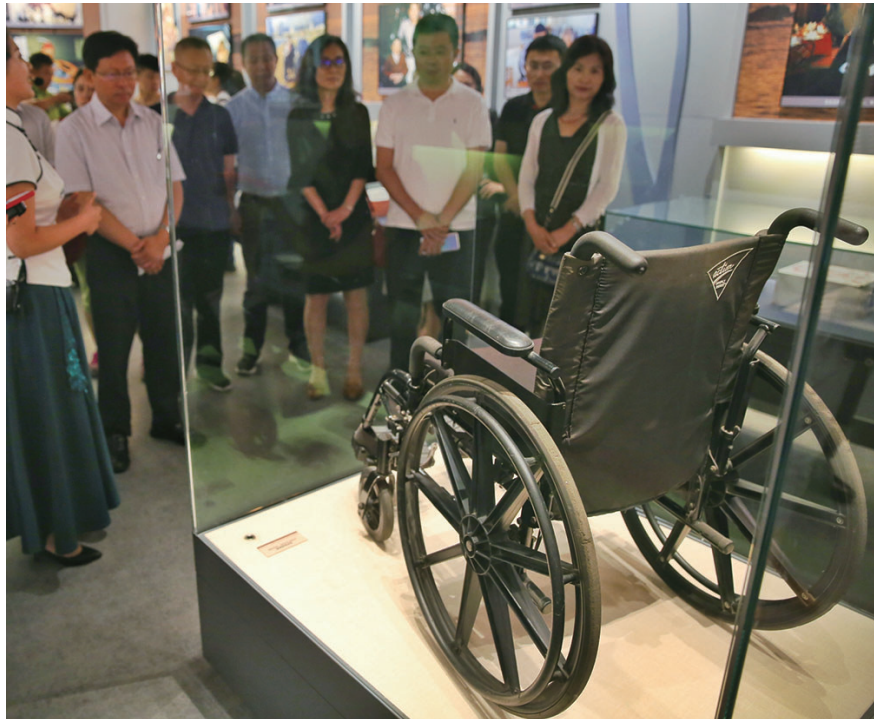
张学良将军的轮椅。