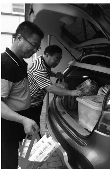
老人买了一车的物品,送到山沟里孩子们的手上。

当老人把牛奶等物品搬到教室后,又分别给孩子们选了合适的鞋子给穿上。孩子们穿上新鞋纷纷对爷爷奶奶表达了谢意,老人看到多数的孩子只有一袋方便面时,老人说:“这怎么可以呀,长此以往孩子们肯定会营养不良啊!这个问题必须解决”。